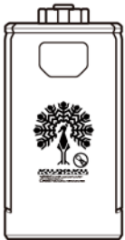
クジャクカンドロイド 本体…1